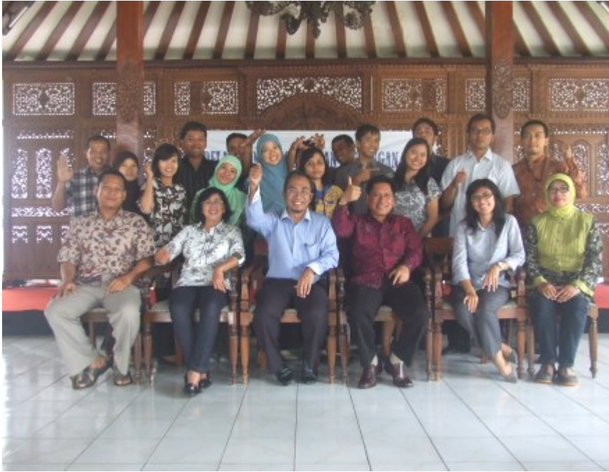
04. Pelatihan SOP Keuangan BLU - PIP Semarang