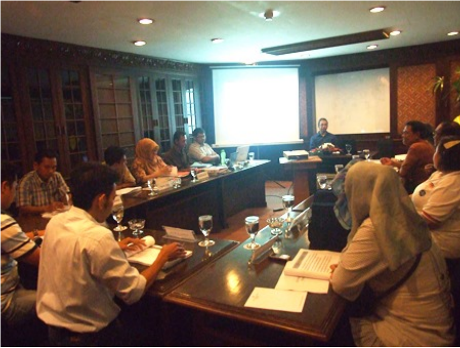
07. Pelatihan SOP Keuangan BLU - PIP Makasar