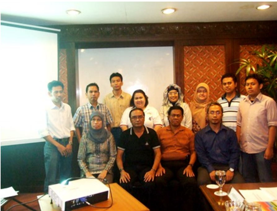
09. Finalisasi Penyusunan SOP Keuangan BLU - PIP Semarang