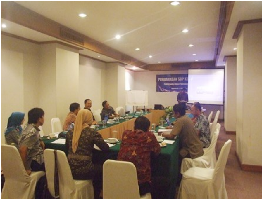
10. Finalisasi SOP Keuangan - PIP Semarang