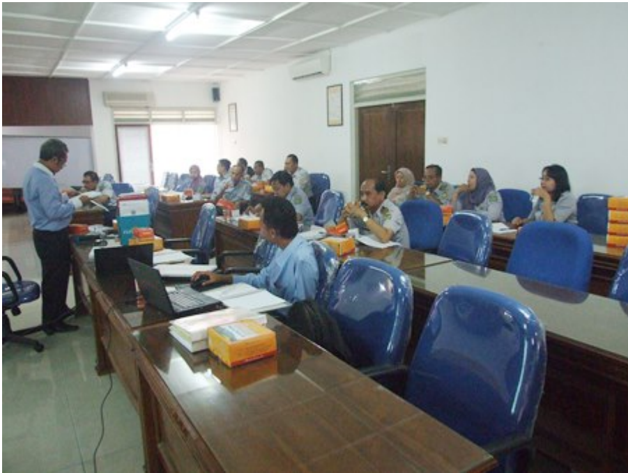
05. Pelatihan SOP Keuangan BLU - PIP Semarang