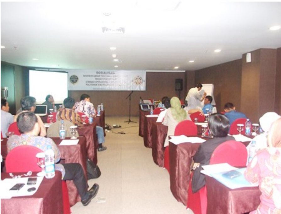
14. Pembahasan SOP Keuangan dengan Bagian Akuntansi Departemen Perhubungan