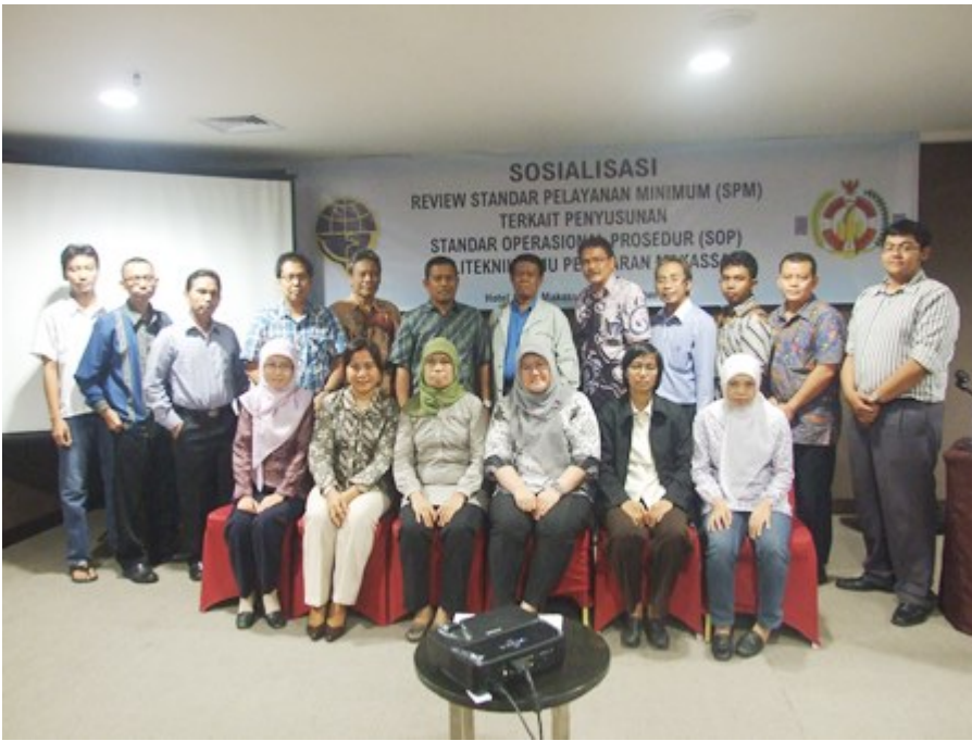
13. Review Akhir Penyusunan SOP Keuangan PIP Makasar