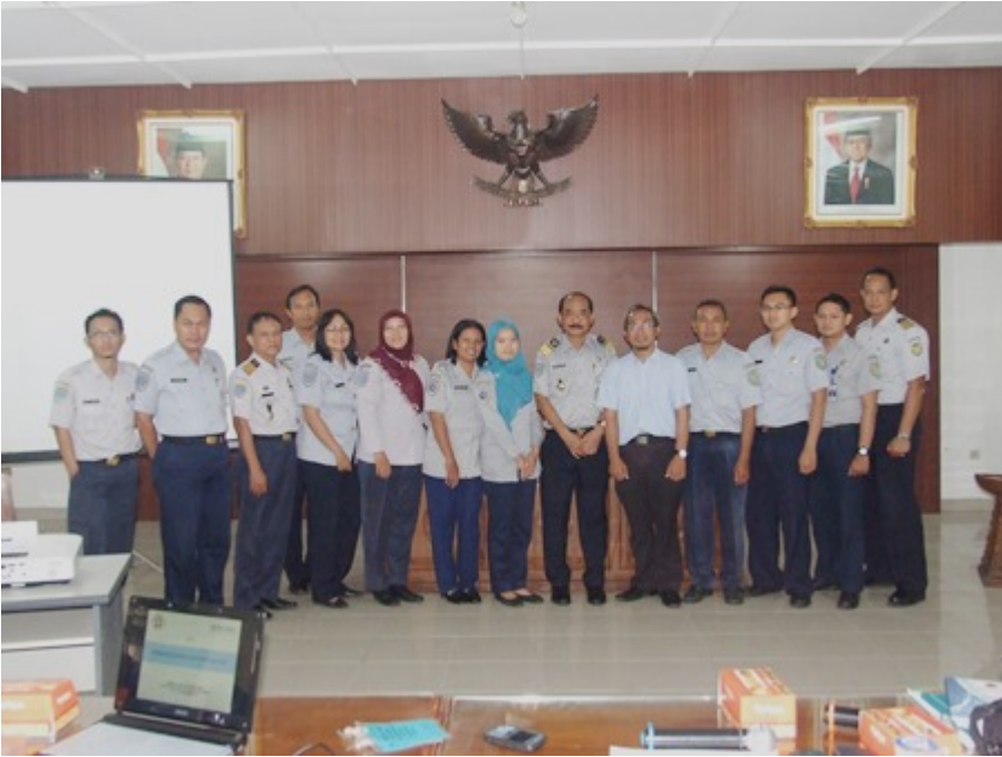
06. Pelatihan SOP Keuangan BLU - PIP Makasar